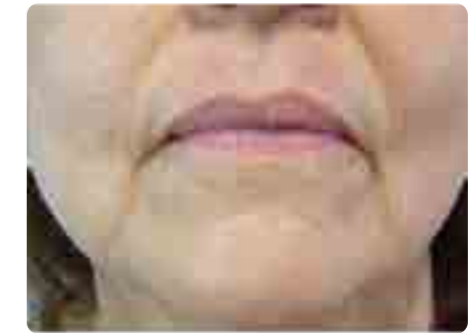
Después de 45 días