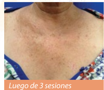
Luego de 3 sesiones