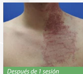
Después de 1 sesión